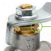
Premistoppa Stuffing box Presse étoupe

Passaggio standard Standard way Passage standard PN25